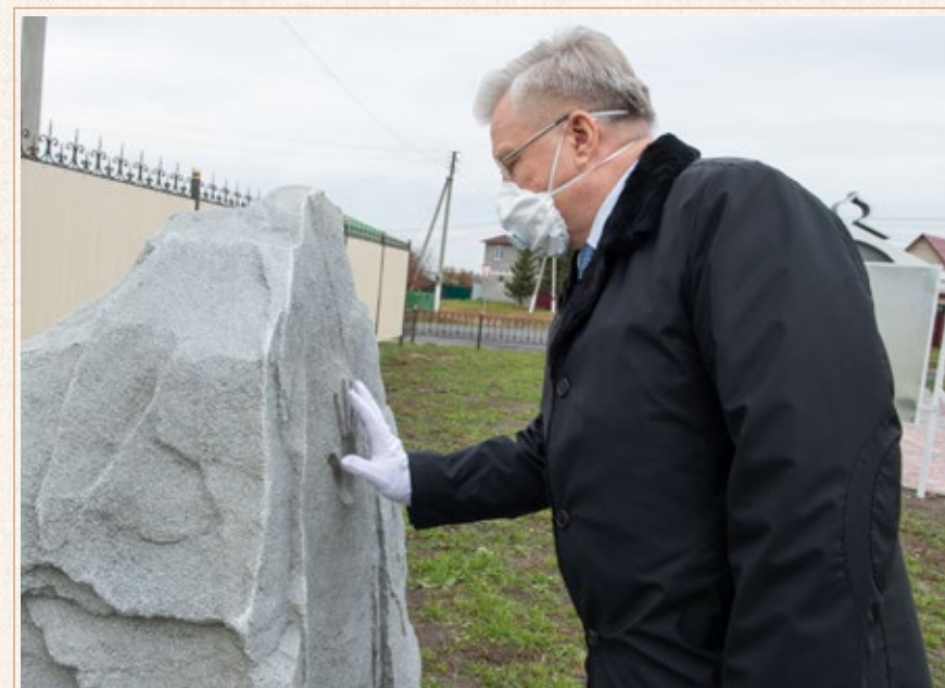
Суерка принимает гостей. Генеральный директор ПАО «Сургутнефтегаз» В. Л. Богданов, глава Суерского сельского поселения Л. В. Гольцман, губернатор Тюменской области А. В. Моор.