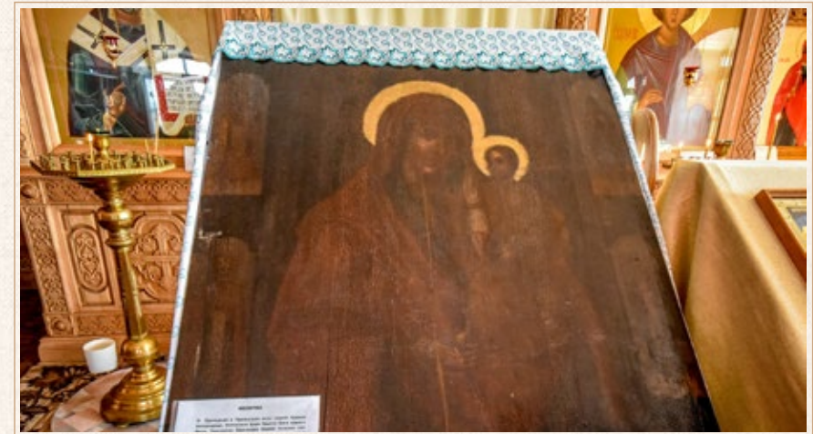
Суерская чудотворная икона Божией Матери «Смоленская». В результате народного голосования святыня вошла в список «Семь чудес Тюменской области». Конкурс на самые яркие, интересные и чудесные места нашего края был приурочен к его 65-летию юбилею