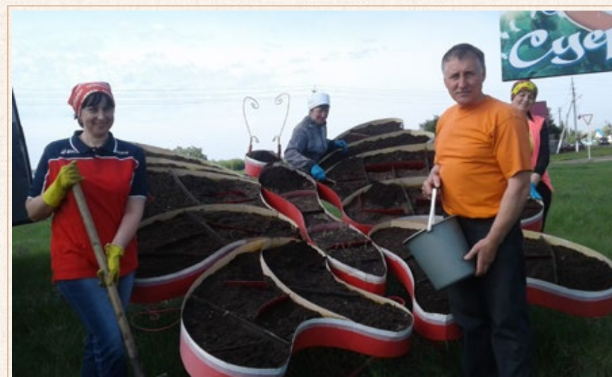
Субботники — наше все!