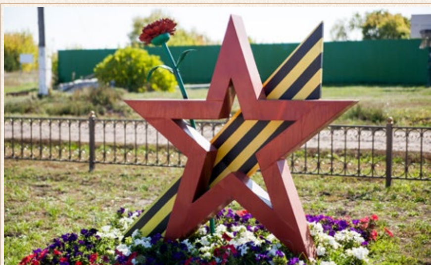
В честь 75-летия Великой Победы в музее под открытым небом «Историко-культурный центр имени Осипа Давыдова» установлен памятный знак «Звезда Победы» и заложена капсула времени с письмом-напутствием для молодежи, которая будет отмечать этот святой и вечный праздник в год 125-летия Великой Победы