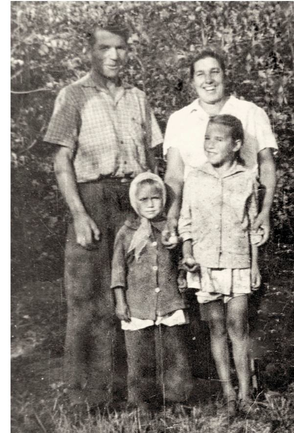
Наша семья в родном яблоневоом саду. 1967 г.